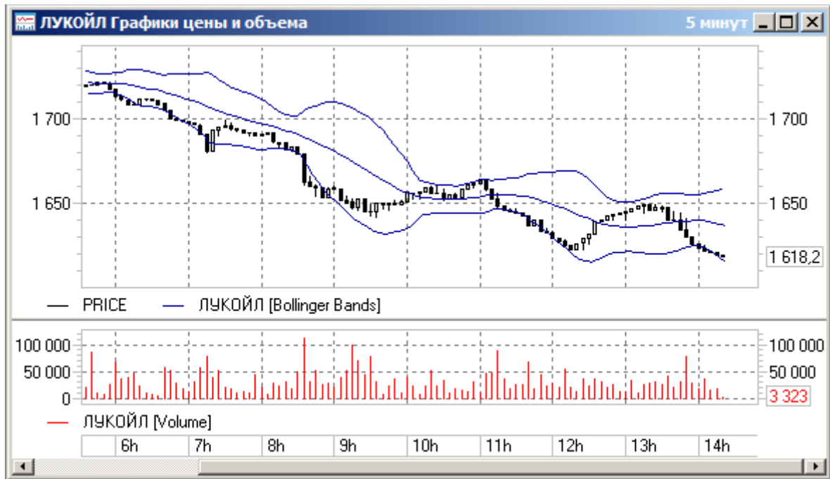
Рисунок 2.2 Окно с графиком цены и индикаторами

Такие же действия необходимо произвести для всех остальных используемых стратегией индикаторов.