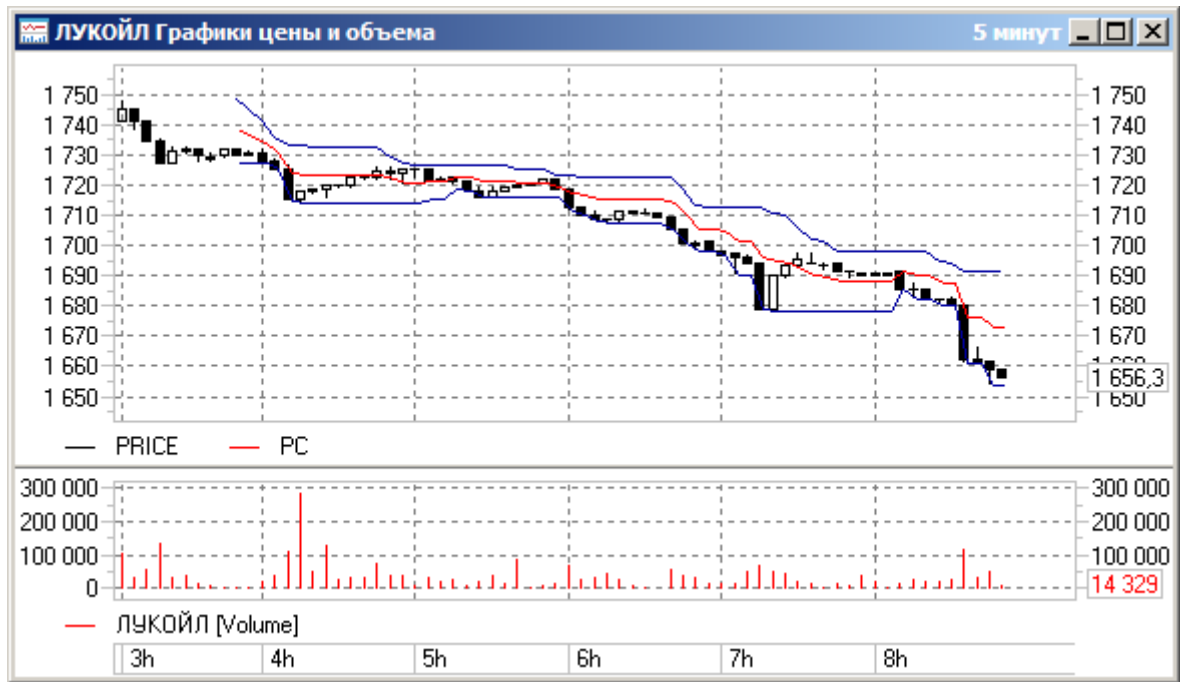
Рисунок 2.2 Окно с графиком цены и индикаторами